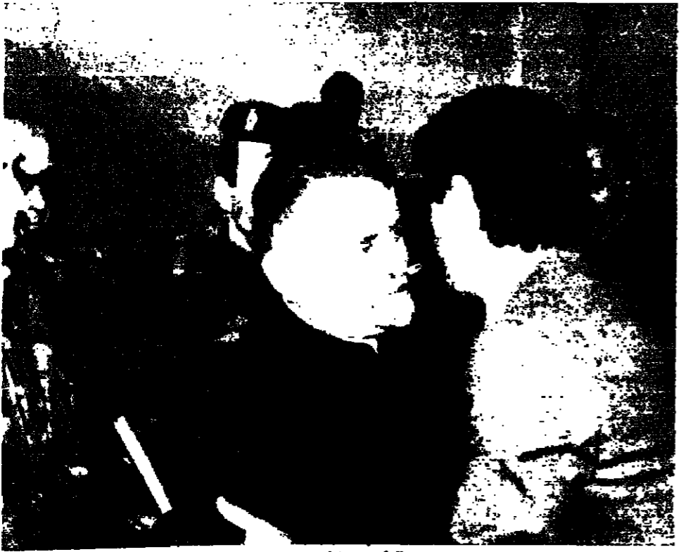
الرئيس يعاقل الاب حلو